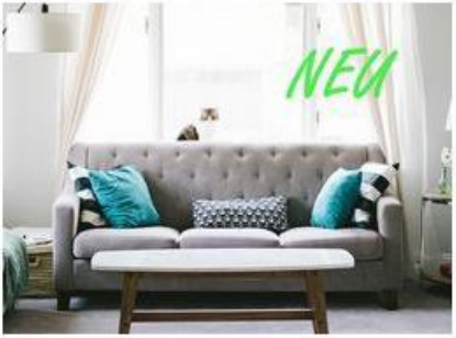
Bauen & Wohnen

Hier kann man sich ein Profil erstellen oder sich anmelden