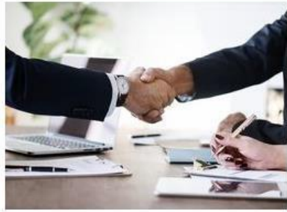
Job & Ausbildung